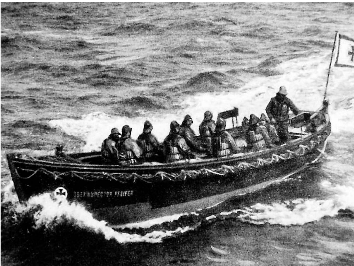
Mutige Seeleute zu Beginn der Seenotrettung Ende des 19. Jahrhunderts: Es ging um die Rettung von Menschenleben.

Hinzu kommt die ausbleibende Empörung von weiten Teilen der Gesellschaft und der Medien: Haben früher solche Unglücke Menschen und Medien mobilisiert, hört und liest man gerade in der Schweiz und auch anderswo kaum mehr etwas. Die beiden grossen linken Parteien der Schweiz? Sie blieben einfach still. Und genau da ist es unsere Verantwortung, solche Geschehnisse, niemals, NIEMALS zur Normalität werden zu lassen. Selbst wenn wir gefühlt Wenige sind, können wir auch in kleiner Anzahl laut und wehrhaft bleiben, können widerständige und kräftige Vernetzungen aufbauen – zwischen Menschen in Abfahrtsländern, Menschen auf der Reise, Aktivist:innen an Transitorten, Angehörigen und Menschen in Ankunftsändern wie