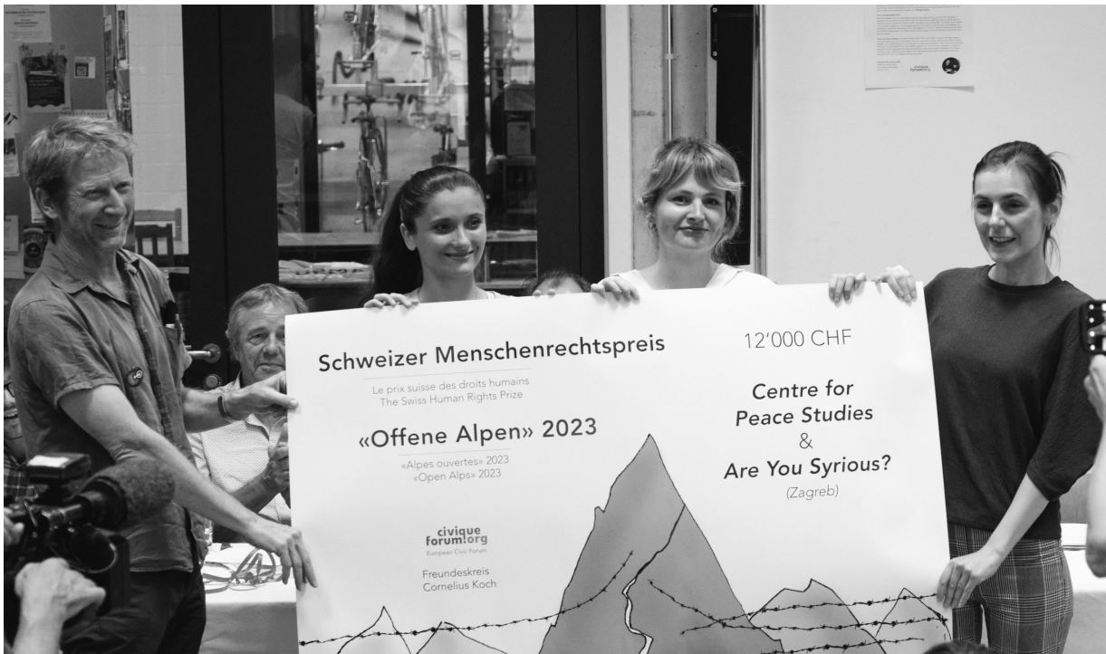
AZB 4001 Basel Europäisches BürgerInnen Forum, 4001 Basel Die Post CH AG

Zeitung des Europäischen BürgerInnenforums